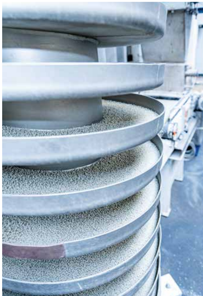
Im Wendelförderer kühlt das Stranggranulat endgültig ab, bevor es verpackt und an den Kunden ausgeliefert wird.